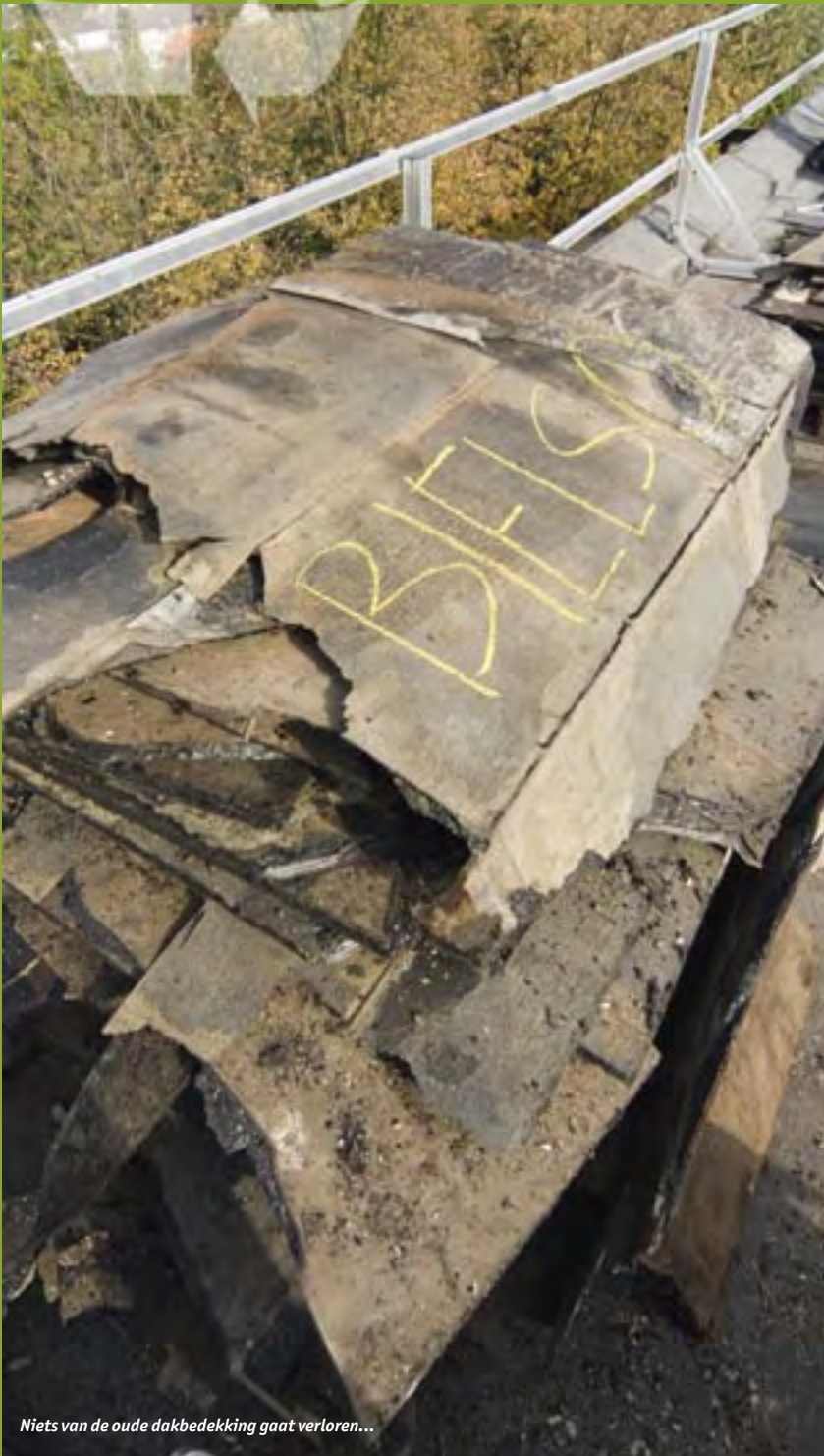
Niets van de oude dakbedekking gaat verloren...

Bij Tablis Wonen uit Sliedrecht voelen ze zich zeer verantwoordelijk voor het milieu. 'Als je de vruchten plukt van een toenemende welvaart, moet je de omgeving ook netjes achter laten,' zo luidt de gedachte. Het is dan ook niet zo gek dat Tablis Wonen, als een van de eerste woningcorporaties, gekozen heeft voor gerecyclede dakbedekking.